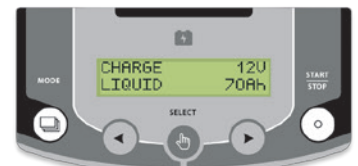
Intuitivt grensesnitt tilgjengelige i 22 språk