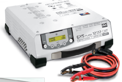
Levert med kabler (5 m - 25 mm 2 )