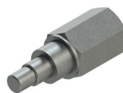
G: Siemens DCP1